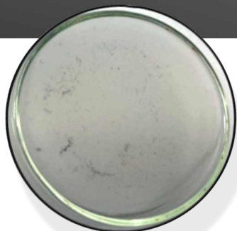
Láhev vyčištěná naším zařízením