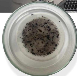
Znečištění lahve dovážené do Evropy