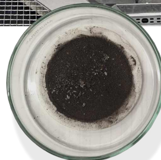
Znečištění láhve vyrobené před rokem 1999